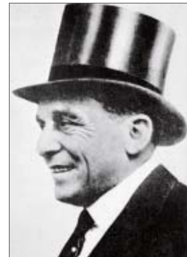
Le magnat Alfred Loewenstein, mort au faite de sa gloire.

« Pour moi, le pilote connaissait l'ancien aérodrome de Saint-Pol, où il a pu faire disparaître des preuves. »