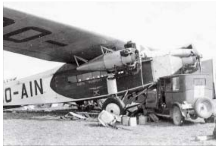
Ambiance avant le décollage d'un Fokker de la Sabena belge, le nez reposant sur une limousine.