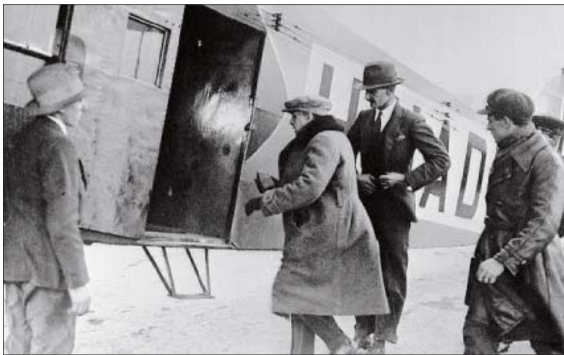
Le 4 juillet 1928, lors d'un ultime Londres-Bruxelles, Loewenstein disparaît au-dessus de Dunkerque.

« Il est le plus important financier européen, touche à des industries nouvelles au Brésil, aux États-Unis et au Canada, où sa photo s'étale dans les journaux. Il aime les champs de course, la fête, a des vil-